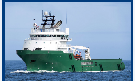
(Hochsee-)Versorgungsschiff / (Offshore) supply vessel