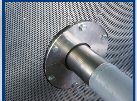
Espey WDK-BHS, verbaut an Schottwand

EagleBurgmann Espey GmbH Thomas Edison-Strasse 19 47445 Moers / Germany